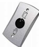
BOTÓN DE PROXIMIDAD

MONTE ALBAN 126 - 108. COL. NARVARTE PONIENTE. CP 03020 MÉXICO CDMX TEL. 71606772 CEL. 5524277653. email. cyroi@cyroi.com